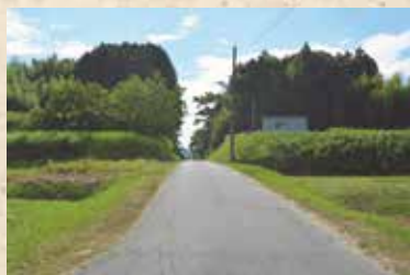
手間～天津駅間軌道跡切り通し