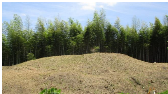
百塚 88号墳墳丘遠景