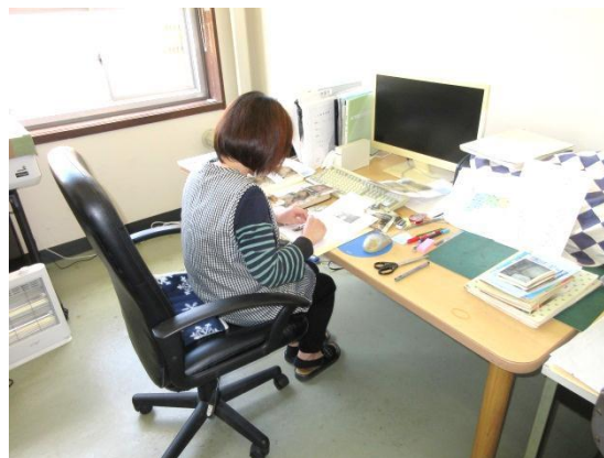
下高氏寄贈資料の整理作業