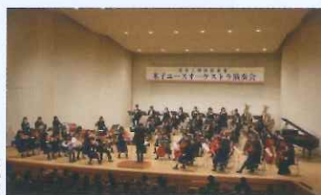
反響板使用時(米子ユースオーケストラ)

反響板を設置することで、マイク等の音響機器を使用しない生演奏の音を、客席の方まで表現豊かに美しい音質で届けることができます。ただし色とりどりの照明を使用したりする演出等は制約されてしまいます。