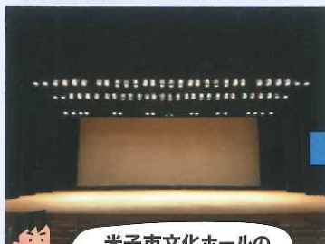
米子市文化ホールの舞台です。

「反響板(はんきょうばん)」とは、主に舞台上での生演奏に対応するために設置される「音響反射板」のことで、オーケストラやピアノ、声楽、吹奏楽などの演奏会の時に登場します。