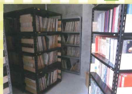
米子市淀江文化センター