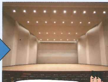
反響板を設置しました。

反響板を設置することで、マイク等の音響機器を使用しない生演奏の音を、客席の方まで表現豊かに美しい音質で届けることができます。ただし色とりどりの照明を使用したりする演出等は制約されてしまいます。