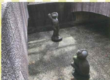
米子市文化ホール