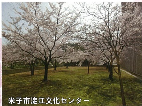
米子市淀江文化センター