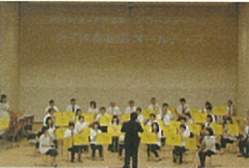
会場 米子市文化ホール