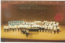
会場 米子市公会堂