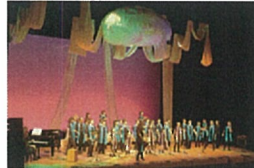
会場 淀江文化センター