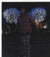
▲一緒に撮影すると羽が生えているかのように映る

米子市公会堂のイルミネーション(オブジェ)は高校生の手作り。米子南高等学校の生徒がテーマを決めデザイン。それをもとに米子工業高等学校の生徒が制作しています。去年からインスタ映え(写真共有サイト「Instagram」に写真をアップロードした時に、ひときわ見栄え良く見える=映えるという意味で用いられる表現。「写真写りが良い」という意味でも使われる)を意識した作品が登場しました。まさに、高校生ならではの発想力です。イルミネーションを見る楽しみに加え、写真撮影も楽しめます。今年はどうなイルミネーションオブジェが登場するのか、ご期待ください。