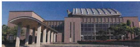
▲米子市淀江文化センター

かつて米子市淀江町にあった「寿劇場」。庶民の娯楽の場として親しまれてきました。しかし、1966(昭和41)年、記録映画「東京オリンピック」を上映した後に閉館。もう一度、市民の皆様が気軽に集まって、郷土芸能などを楽しんでもらえる場所を淀江町に作りたいという思いから立ち上げました。