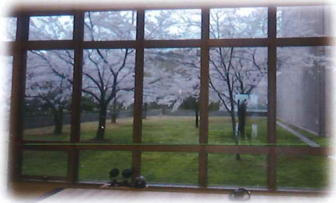
こちらは一昨年の桜奏当日の様子です。満開だとこのような桜をバックにコンサートを行います。

さなめララ♪すてーじの中でも中庭の桜をバックにロビーで開催しているコンサートに桜奏と名付けて10度目の春です。昨年は桜の開花が早く、“桜”奏らしくはなかったのですが、たくさんの美しい音楽の花とお客様の笑顔が咲きました。今回は昨年の来場者アンケートにいただいたコメントの一部をご紹介します。