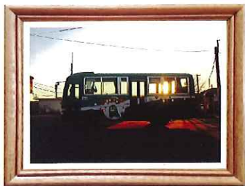
2016 年お題の部 優秀賞「夕陽を乗せて」

“水と緑と史跡のまちよどえ”の魅力を再発見し発信していくためのフォトコンテストに今年もたくさんの作品が集まりました。