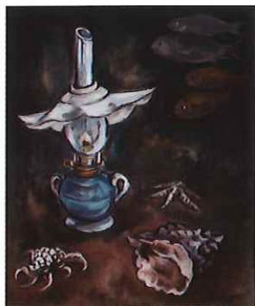
妹尾輝雄《ランプ》個人蔵